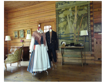
Bromarv modelldräkterna visades i Villa Mechelin i Bromarv

Uppbevaringen av modelldräkterna har granskats och åtgärdats så att modelldräkternas kondition inte försämras.