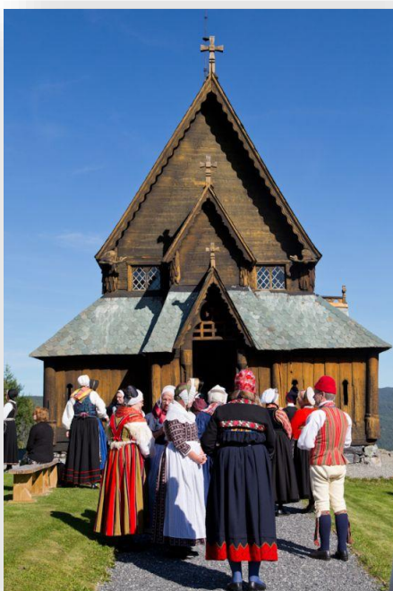
Deltafarna vid det nordiska dräktseminariet i Valdres