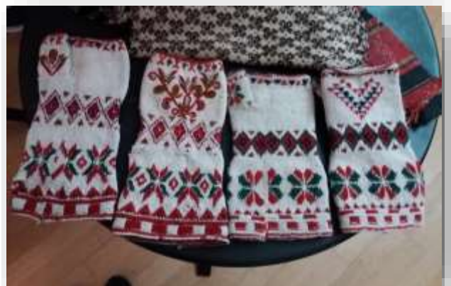
Stickade halvvantar från Sverige

Brage samarbetar med övriga nordiska folkdräktorganisationer och deltar i de nordiska dräktseminarier som ordnas vart tredje år i ett av de nordiska länderna. Mellan seminarierna ordnas också mellanmöten. 5–10 augusti ordnades ett nordiskt dräktseminarium i Danmark med ca 60 deltagare från de nordiska länderna. Temat för seminariet var stickning i de nordiska folkdräkterna. Det ordnades föreläsningar, workshops och utflykter.