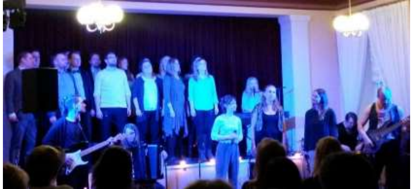
Mandys nyckel och Let Us be Frank

Medlemmar från Idun skötte om pausservering.