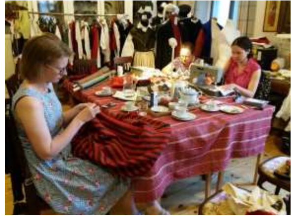
Syjuntan på gång

En ny satsning för år 2018 har varit lånedräkterna och att inventera och korrigera dem. Brages syjunta kom igång i maj och har under hösten samlats tisdagskvällar på dräktbyrån. Ca fem frivilliga har aktivt deltagit i syjuntan och arbetar med att få lånedräkterna uppdaterade till nutidsmått, komplettera dem med delar som saknas, tvättat och reparerat delar.