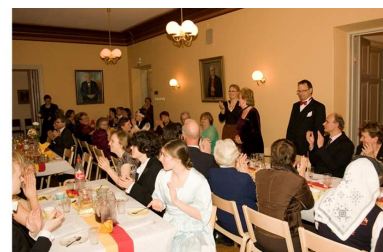
Föreningen Brages Ryska Bal 5.12 2008